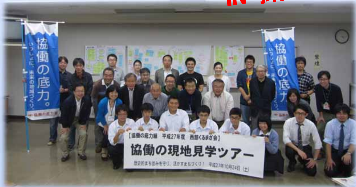
現地見学の様子(まち歩き)