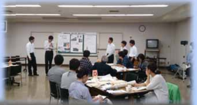
常葉学園菊川高等学校の 生徒のみなさん