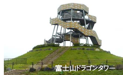
富士山ドラゴンタワー

「富士山ドラゴンタワー」から富士山～駿河湾の360度の美しいパノラマ景観をみよう 船型歴史学習施設「ディアナ号」もあるよ!