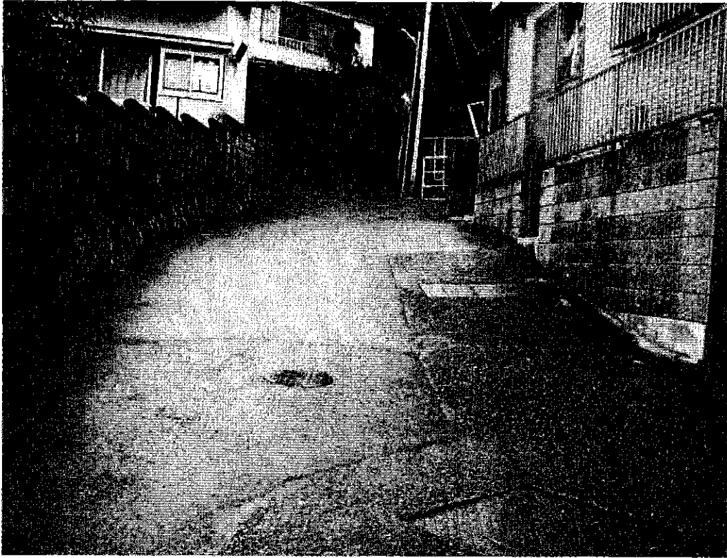
逢初川下流（道路下暗渠部）