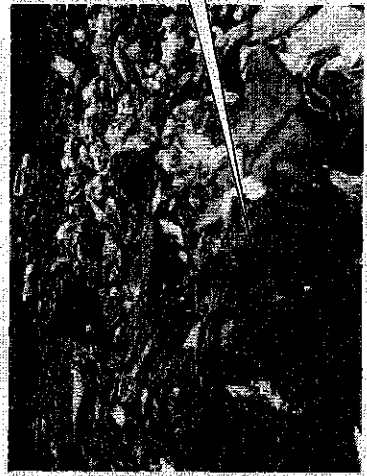
屑、木くずなどの廃棄物が奥にある。