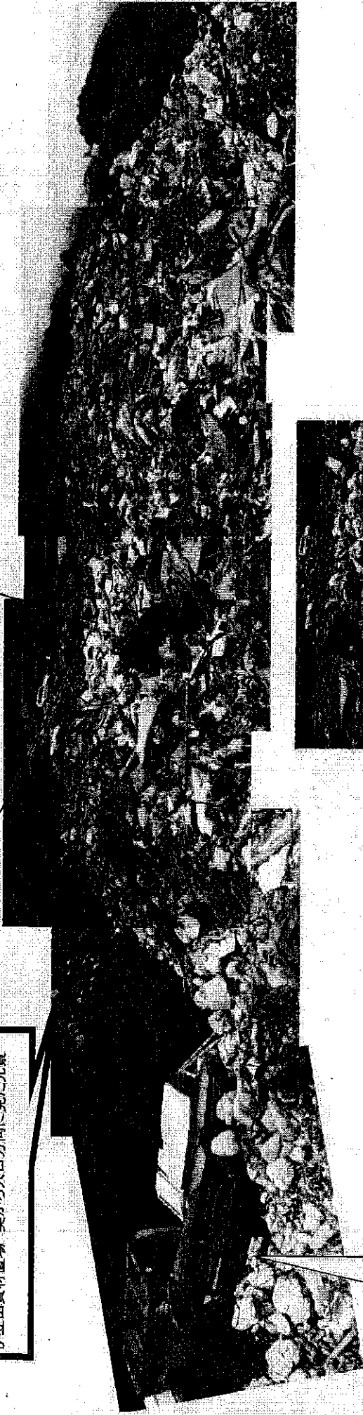
伊豆山資材置場 奥から入口方向に見た光景