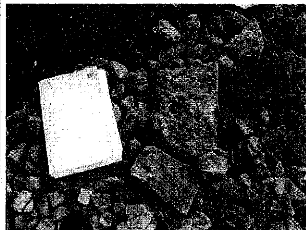
大きさがノート(A4)程のがれき