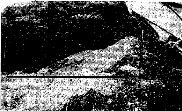
丸のあたりは残土の山だったが平らになった。