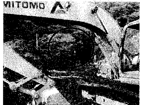
このあたりの下に木くずがあるらしい