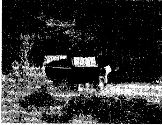
残土を運んできたトラック