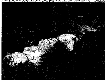
上段の残土の奥側のフレコン、丸太