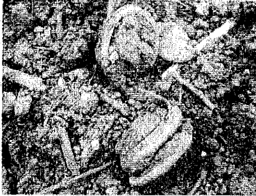
木くずの土の中に入っているもの 廃プラ様の丸いもの