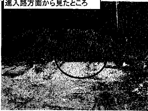
進入路方面から見たところ