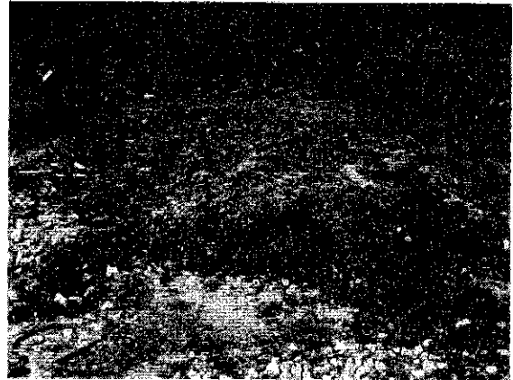
↑ 新たな残土 ↓