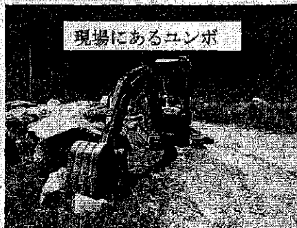
現場にあるユンボ