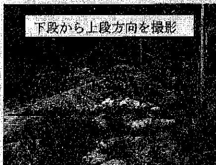
下段から上段方向を撮影