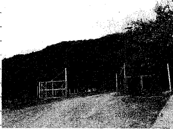
① [Redacted] (熱海市伊豆山赤井谷残土処分場)