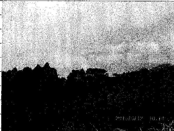
② [Redacted] (熱海市伊豆山赤井谷残土処分場)