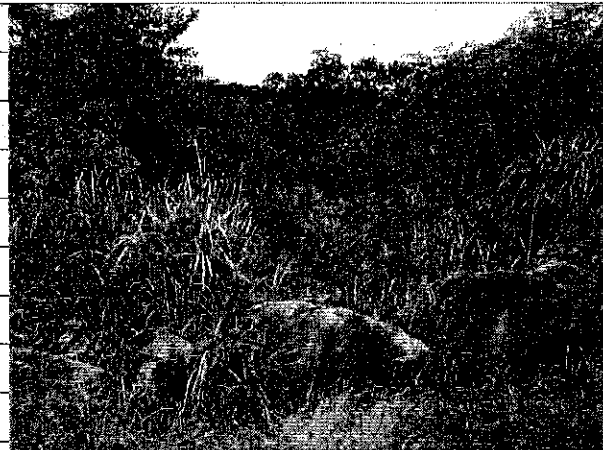
① [Redacted] (熱海市目金町)