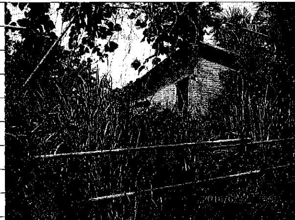
② [Redacted] (熱海市目金町)