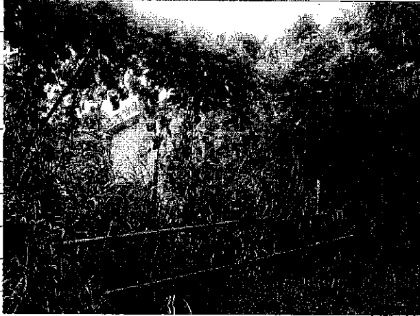
① [Redacted] (熱海市目金町)