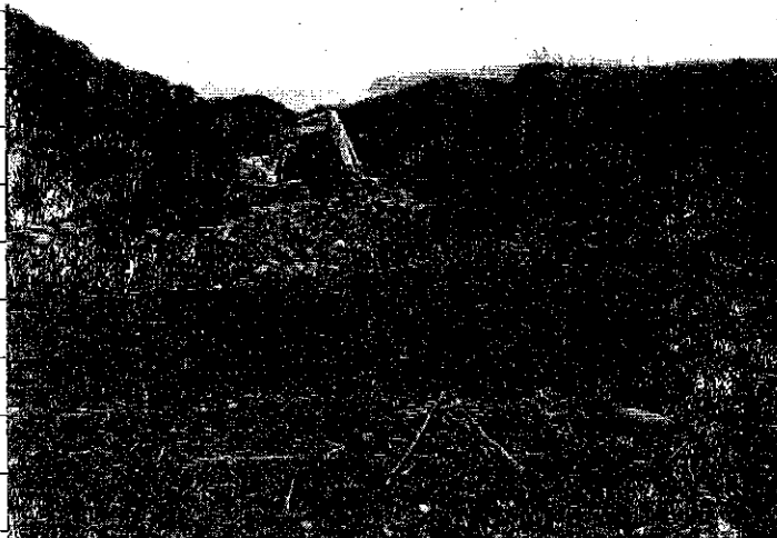
② [Redacted] (熱海市日金町)