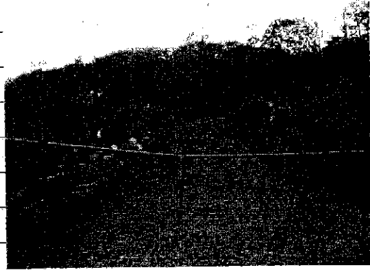
① [Redacted] (熱海市日金町)