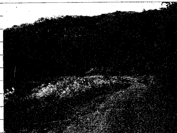
② [Redacted] (熱海市伊豆山赤井谷残土処分場)