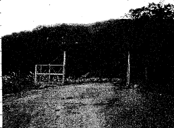
① [Redacted] (熱海市伊豆山赤井谷残土処分場)