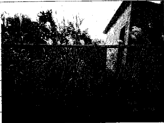
④ [Redacted] (熱海市日金町)