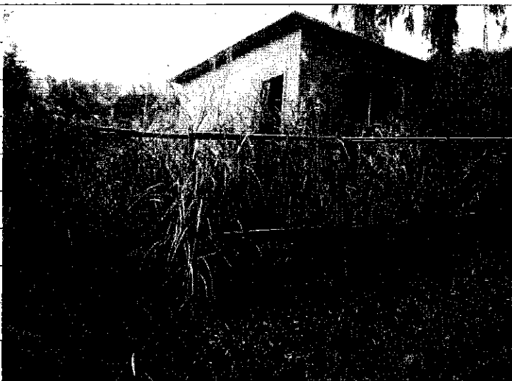
③ [Redacted] (熱海市日金町)