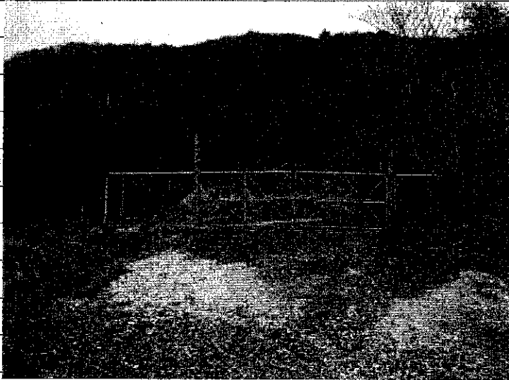
① [Redacted] (熱海市伊豆山赤井谷残土処分場)