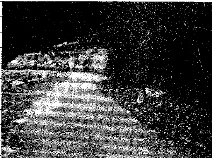
② [Redacted] (熱海市伊豆山赤井谷残土処分場)