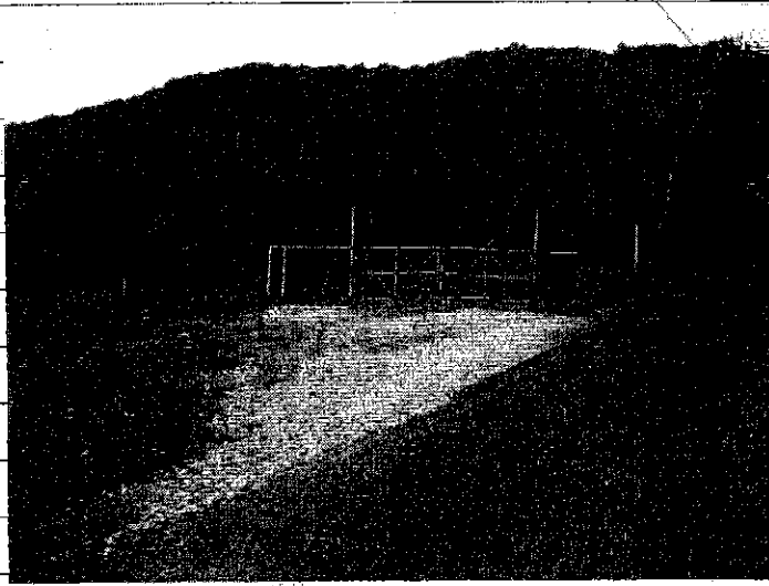
① [Redacted] (熱海市伊豆山赤井谷残土処分場)