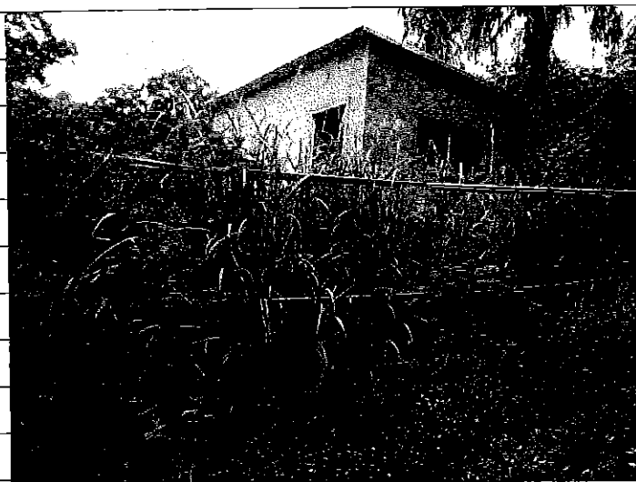
② [Redacted] (熱海市目金町)