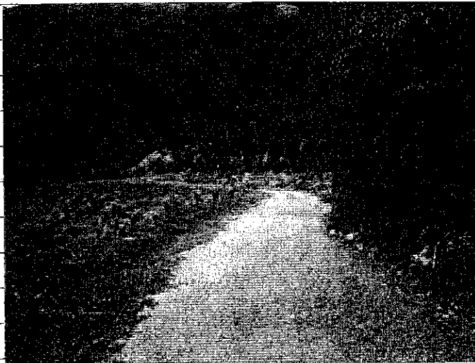
② [Redacted] (熱海市伊豆山赤井谷残土処分場)