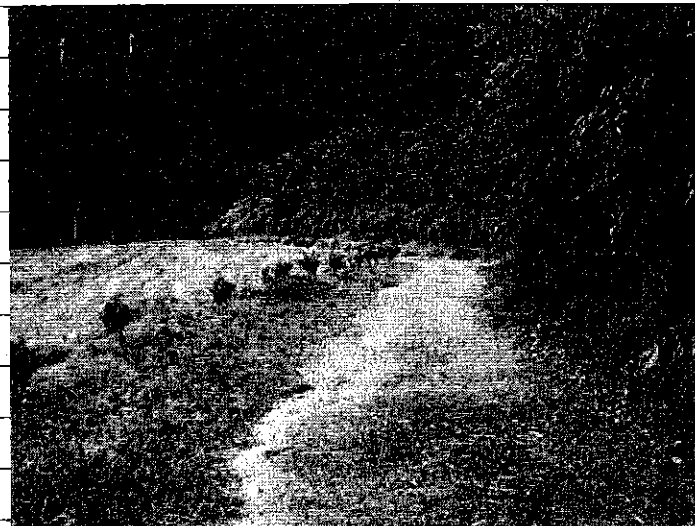
② [Redacted] (熱海市伊豆山赤井谷残土処分場)