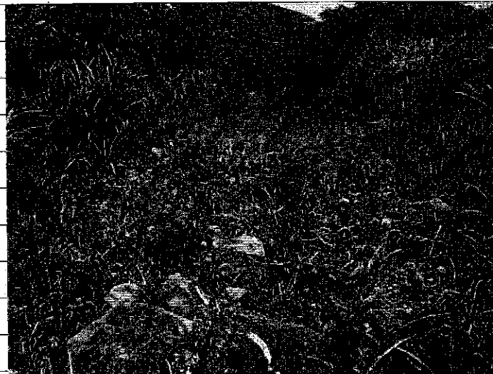
② [Redacted] (熱海市伊豆山)