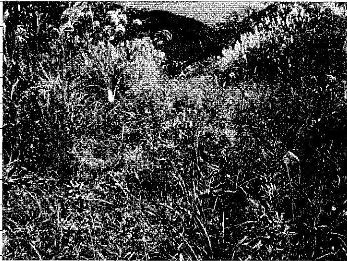
② [Redacted] (熱海市伊豆山)