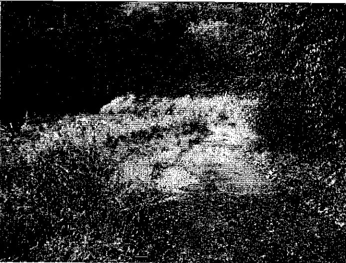
② [Redacted] (熱海市伊豆山赤井谷残土処分場)