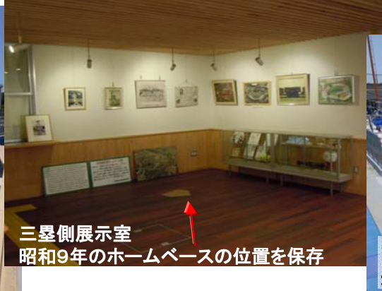
三塁側展示室 昭和9年のホームベースの位置を保存