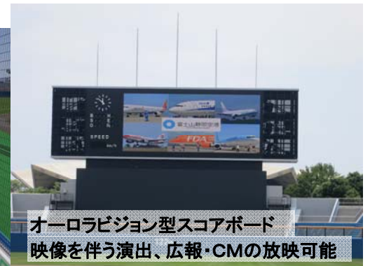
オーロラビジョン型スコアボード 映像を伴う演出、広報・CMの放映可能

いっしょに、未来の地域づくり。New Public Engineering for SHIZUOKA