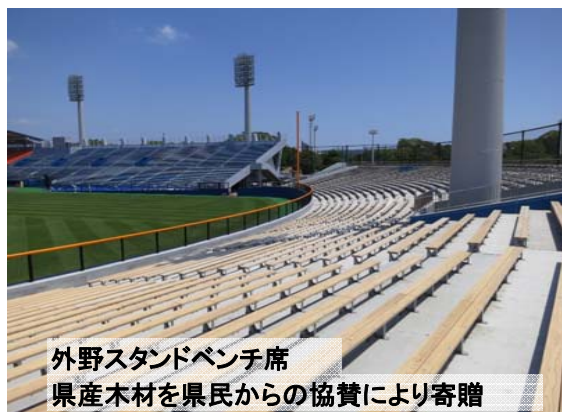
外野スタンドベンチ席 県産木材を県民からの協賛により寄贈