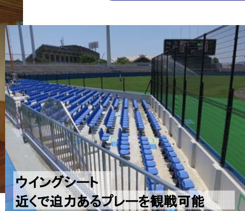
ウイングシート 近くで迫力あるプレーを観戦可能