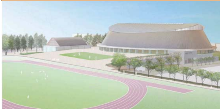
新体育館完成イメージ模型