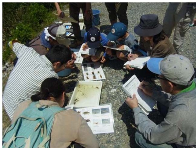
○ どんな生き物が棲んでいるかな！？

この取組は年4回（春夏秋冬）行っています。 次回の調査（夏）は8月17日（土）を予定しています。