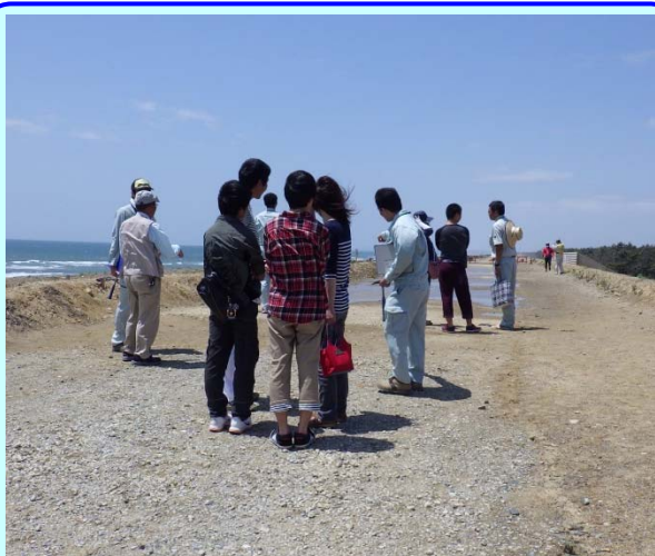
➤ 防潮堤の進捗状況を確認