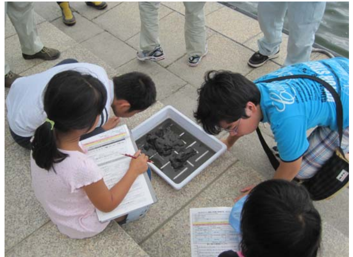
▲ 佐鳴湖の底の泥はどんなニオイ？