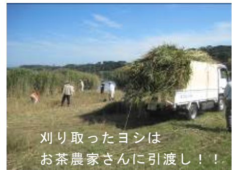
刈り取ったヨシは お茶農家さんに引渡し!!