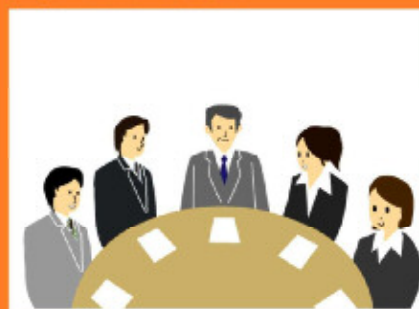
災害対応について関係者で振り返り