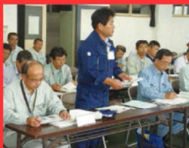
気象状況の解説・助言