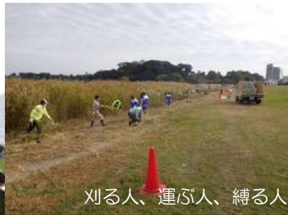
刈る人、運ぶ人、縛る人、みんなで手分けし手際よく！！