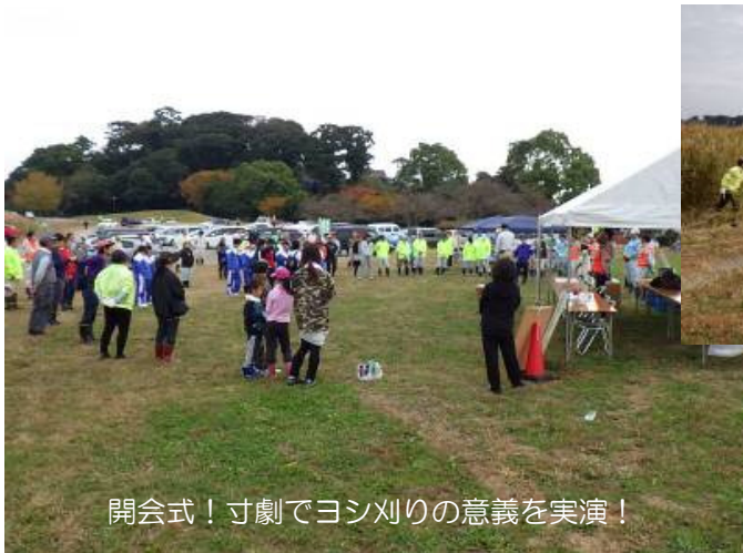
開会式！寸劇でヨシ刈りの意義を実演！