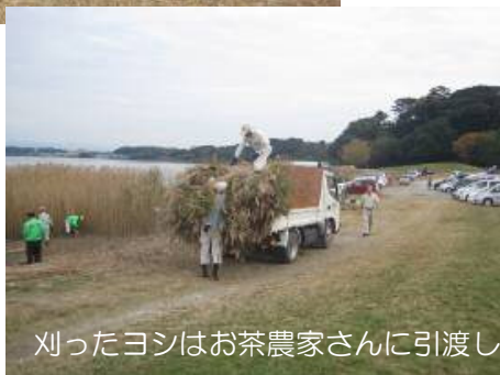
刈ったヨシはお茶農家さんに引渡し