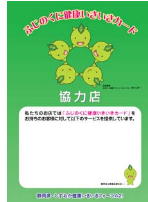
お店に掲示してもらう協力店ポスター(A4)