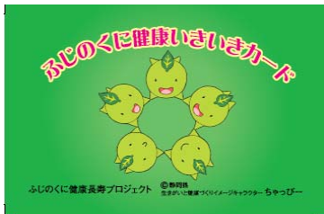
県民が提示する健康いきいきカード(表)