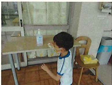
アルコール消毒もしっかりと！