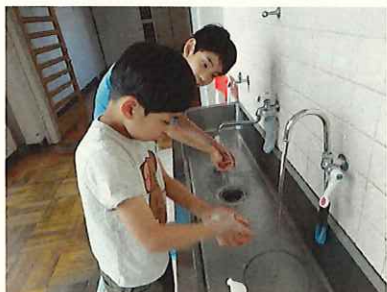
よく泡立てて丁寧に洗えています！

今年度も寒さが身に染みる季節となってまいりました。例年であれば、これからインフルエンザを警戒していかなければなりません。今年度は新型コロナウイルス対策も求められています。新型コロナウイルス対策は、「感染予防」と「社会経済活動の段階的な再開」を両立させる「withコロナ」という新しいフェーズになりました。個人対策の徹底が社会全体を守ることにつながります。学園内でも今までとは違った新しい生活様式が求められるようになり、特に求められる「距離」「マスク」「手洗い」を意識した生活を送り職員・児童ひとり一人が対策を徹底することで学園にウイルスを持ち込まないよう努めています。