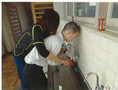
学園にウイルスを持ち込みません！