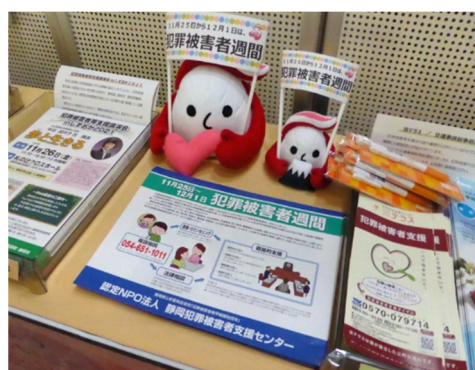
静岡県立中央図書館における展示広報