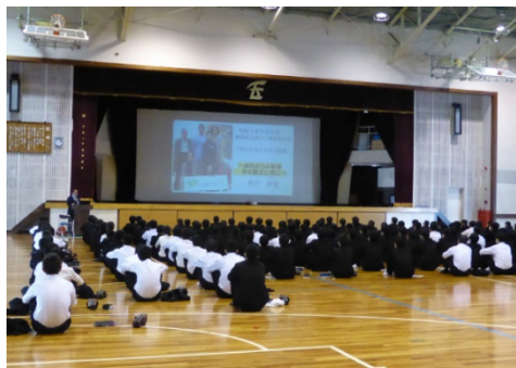
命の大切さを学ぶ教室