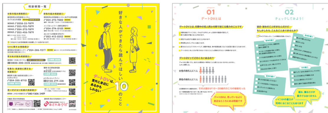
DV防止パンフレット

また、県庁、静岡県男女共同参画センターあざれあにおいて、DV防止啓発広報を行ったほか、パンフレット等の配布により、相談電話等の情報提供を行いました。【男女共同参画課】