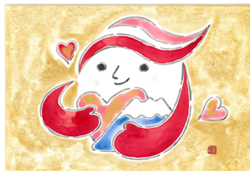
犯罪被害支援貢献者に対する表彰