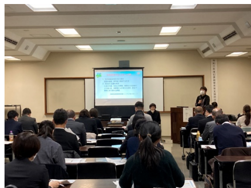
静岡県犯罪被害者等支援担当者研修会（中部、西部）