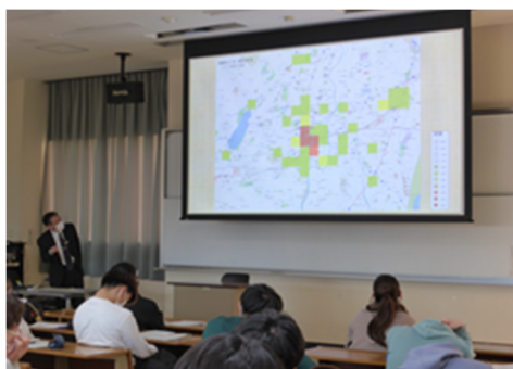
大学における犯罪被害者支援に関する講義