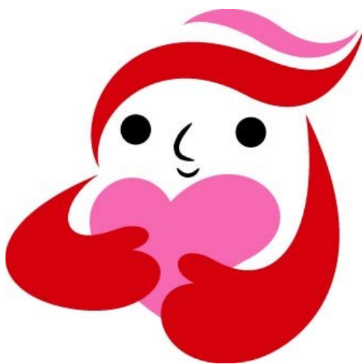
犯罪被害者等支援シンボルマーク 「ギョットちゃん」