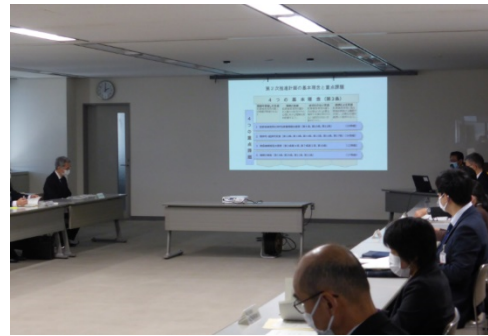
静岡県犯罪被害者支援連絡協議会（警察本部）