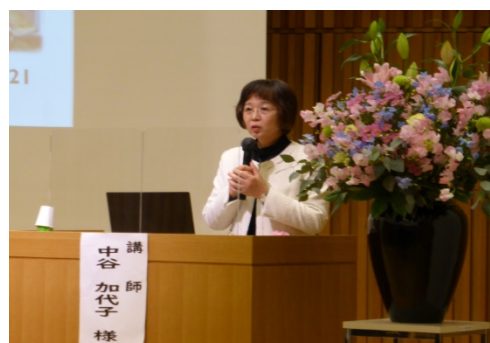
静岡県犯罪被害者等支援講演会 in しずおか 2021