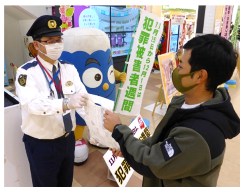
大型商業施設における広報活動