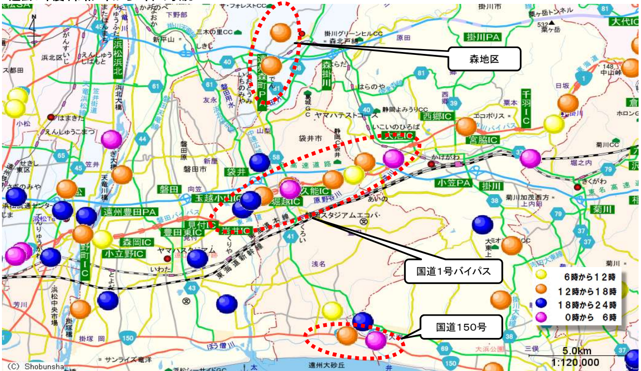
過去5年度(令和1年から5年)の状況