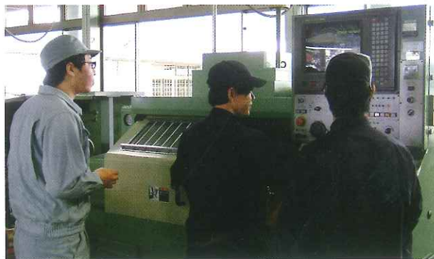
【レディーメイド型研修実施風景】

沼津技術専門校の「在職者訓練制度」に関しては、さんしんNEWS第262号（平成29年5月発行P7）で、特集としてご紹介させていただきました。