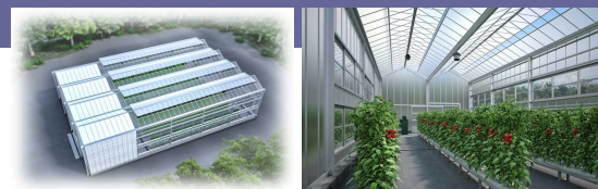
実証研究施設 (イメージ)