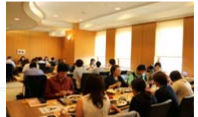
※ランチミーティングのイメージ