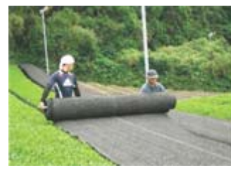
茶の被覆作業の実施