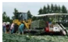
機械化体系の導入