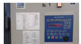
環境制御盤の導入