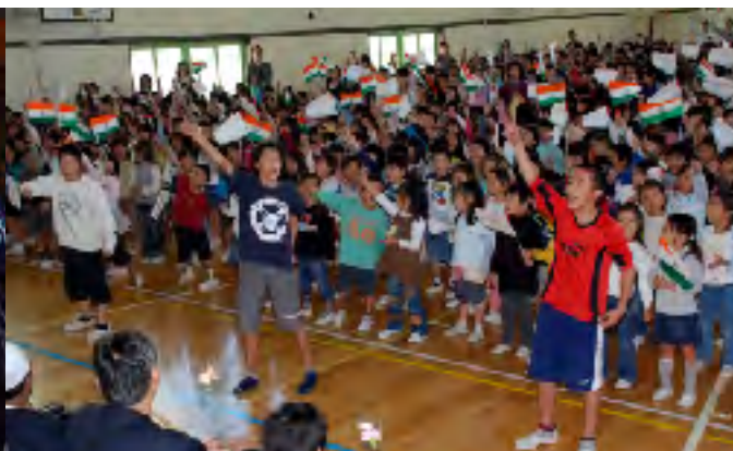
インド選手団と交流する静岡市立富士見小の児童