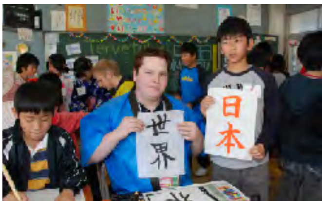
フィンランド選手団と交流する沼津市立開北小の児童

1つの学校が技能五輪に参加する1つの国を応援する取り組みで交流を図った。開幕直前の交流会では約1,200人の選手・関係者が44校を訪れ、大会では総勢約11,000人の小・中学生が見学を訪れた。