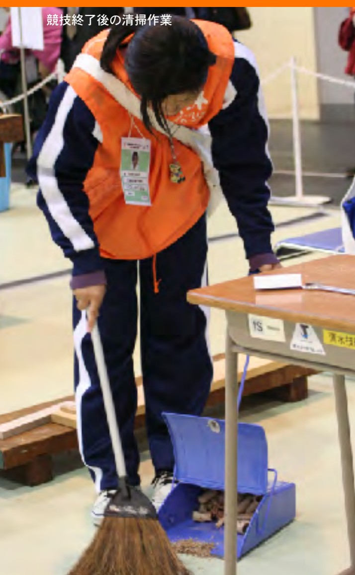
競技終了後の清掃作業