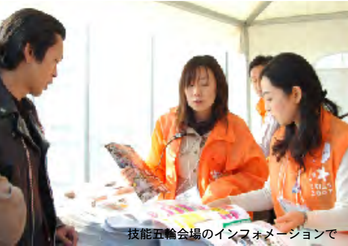
技能五輪会場のインフォメーションで