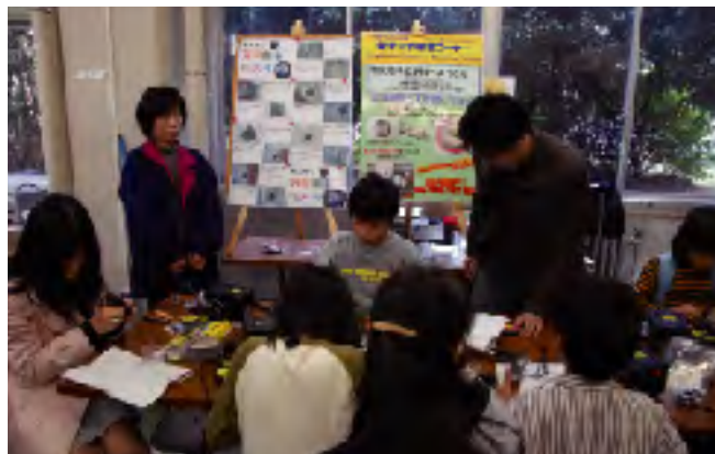
子どもたちが真剣に取り組んだものづくり体験