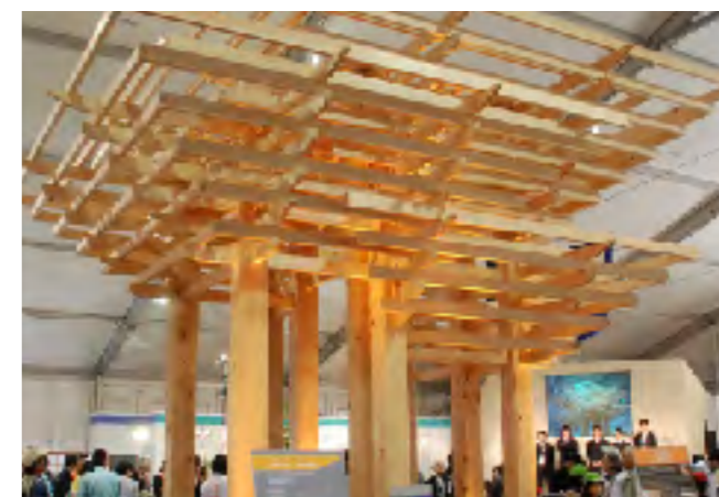
完成したシンボルモニュメント「入和組」