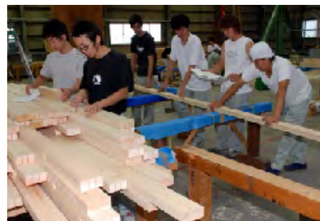
木造建築のエキスパートを目指す6人を中心にデザインから製作までを手掛けた

建築家隈研吾氏の監修の下約半年間かけて、ジャパンスキルズビレッジに設置されたシンボルモニュメントを製作した。