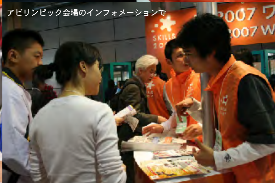
アビリンピック会場のインフォメーションで