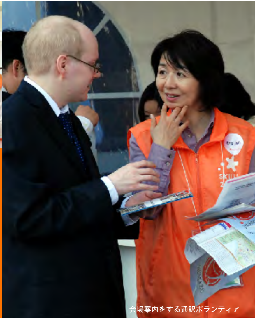
会場案内をする通訳ボランティア