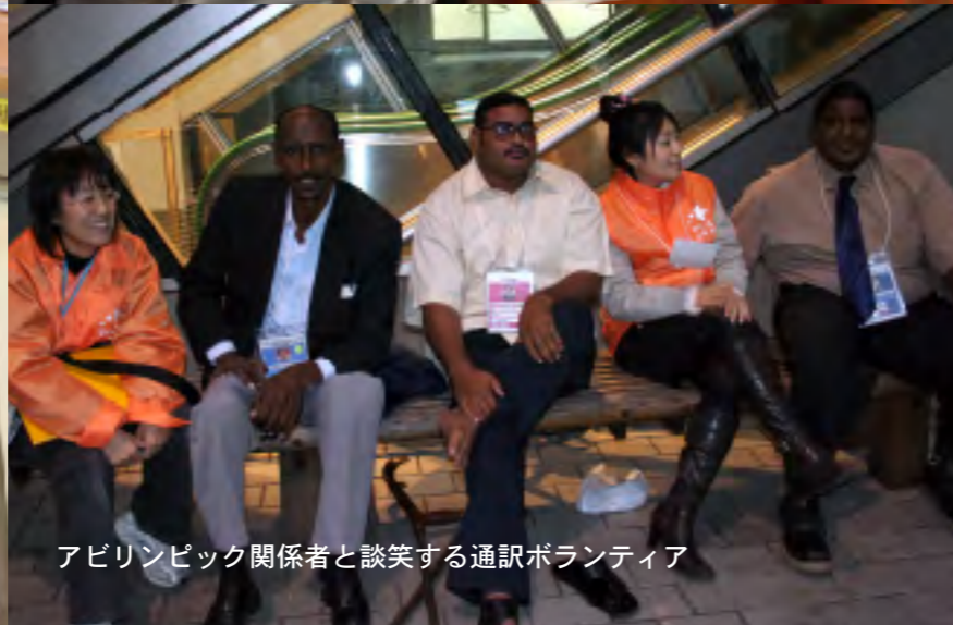
アビリンピック関係者と談笑する通訳ボランティア