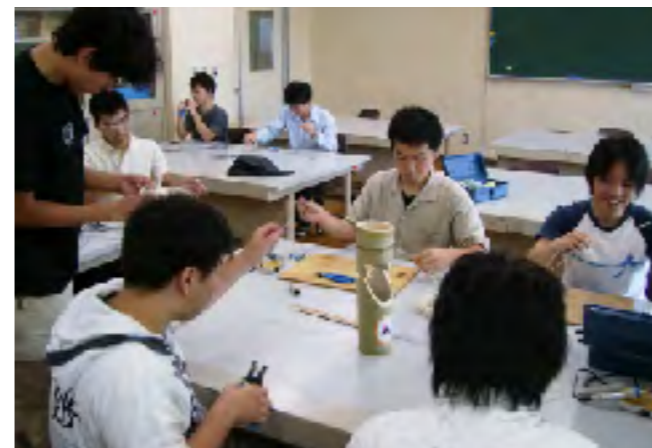
沼津商工会議所や企業との協働で進められた製作

「かぐや姫灯路(とうろ)」と名付けられた門池会場の進入通路に設置された120本の竹灯籠を製作した。