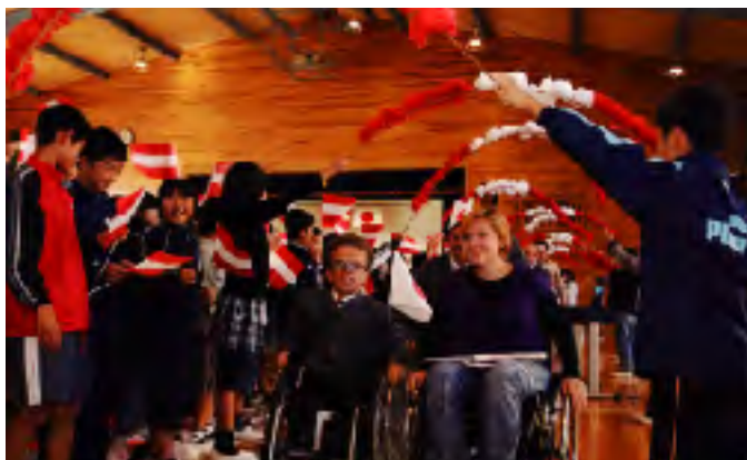
オーストリア選手団の来校を歓迎する静岡市立長田西小の児童

アビリンピックの選手・関係者と市内17校、約9,000人の児童・生徒が交流を図った。事前に、応援する国について学習し、選手・関係者が学校を訪問する交流会を開催した。会場にブースも出展した。