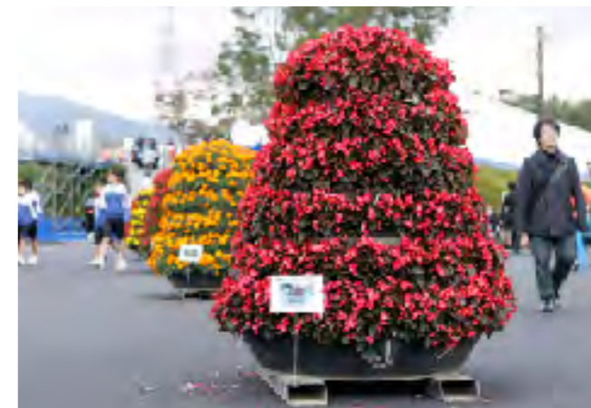
技能五輪会場の花モニュメント