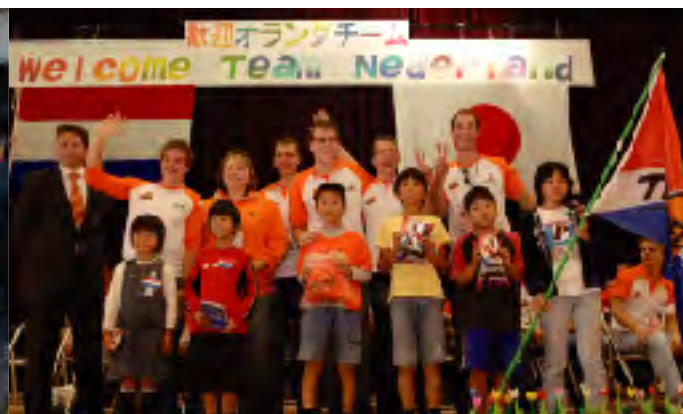
オランダ選手団の歓迎集会をする沼津市立金岡小の児童