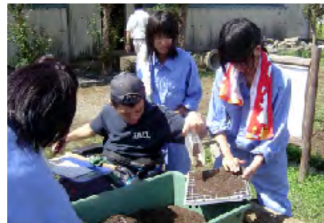
田方農高生、沼津・東部両養護学校生と一緒に種まき