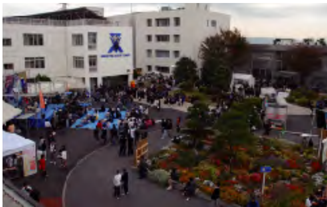
高専機構や全国の高専(宮城高専、豊田高専など)も参加した

会場となった同校では、学生グループが門池おもてなし広場で「ものづくりブース」出展を行った。また、大会の同時開催行事として、「オープンキャンパス」を開催し、学科展示、ものづくり体験などを行った。