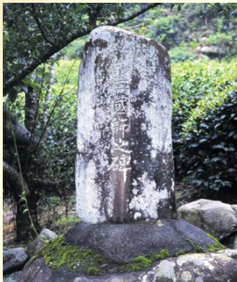
聖一国師生誕の碑(静岡市柘沢)