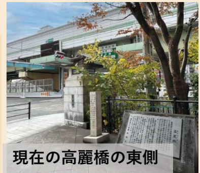
現在の高麗橋の東側

守口からいよいよ大坂へ入り、高麗橋にたどり着くまでに経由したのが八軒家浜です。8軒の旅館(あるいは家)があったことがその名の由来ともされています。東海道の終点である高麗橋は、幕府が工事費を負担した重要な公儀橋でした。大坂城と商人の町をつなぐ橋でもあり、商人が住む西側は米問屋、呉服商、両替商など多くの店が並びました。高麗とは古代に朝鮮からの使者を迎える迎賓館があったから、または豊臣時代に朝鮮との通商の中心地だったからともいわれます。1870(明治3)年に大阪で初めての鉄橋に架け替えられ、その後、1929(昭和4)年に鉄筋コンクリート製のアーチ橋になり、現在に至ります。