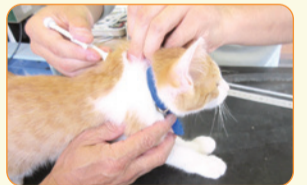
▲装着処置を受ける猫

ペットを飼うことは命を預かることです。虐待や遺棄は犯罪です。飼い主には動物を健康で快適に、最期まで飼い続ける責任があります。人と動物が共生する社会を目指しましょう。