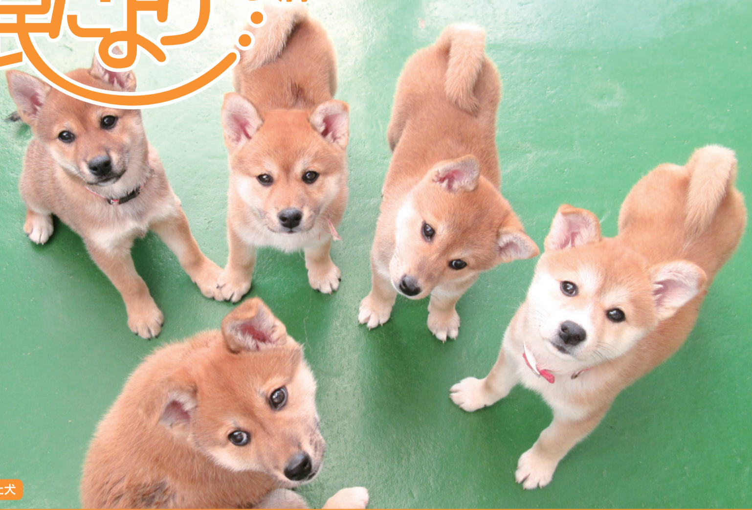
県内で保護された犬