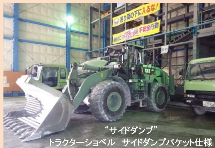
“サイドダンプ” トラクターショベル サイドダンプバケット仕様

掘削して崩した土砂をズリと呼びます。このズリを坑内でダンプトラックに積込む機械がトラクターショベルです。トンネルで使用するトラクターショベルは、“サイドダンプバケット仕様”になっています。通称“サイドダンプ”と呼んでいます。狭い坑内でもスムーズにダンプトラックに積込ができるように、バケットを横向きに反転できるため、ダンプトラックの荷台に真横からズリを積み込むことができます。この現場のサイドダンプは、1回で約7tの土砂を積み込むことができます、力持ちです。