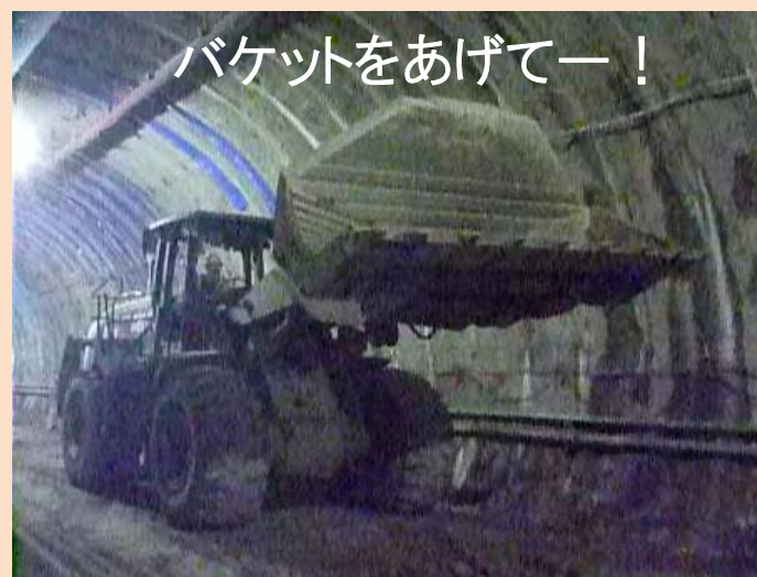
バケットをあげてー！