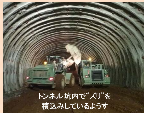
トンネル坑内で“ズリ”を 積み込んでいる様子