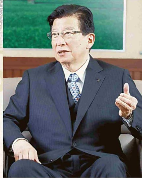
静岡県知事 川勝 平太