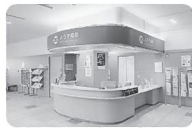
▲よろず相談カウンター

例えば、がんと言われてショックで眠れないとか、自分が入院中に親の介護や子どもの世話はどうしたらいいかなど、がん患者さんやご家族が抱く不安や悩み、経済面や仕事に関する事など、さまざまな相談に応じています。