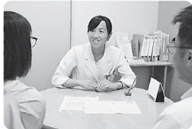
▲個室での対面相談

病気になったことで生じる暮らしや経済的な悩み、副作用による生活への影響、家族や職場での人間関係の問題など、あらゆる相談が寄せられます。相談者の気持ちに寄り添いながら、一緒に考え、時には利用可能な社会資源を情報提供して利用を促し、その人にあった解決に向けてサポートします。最近は、治療と仕事の両立に関する相談や身寄りのない方の相談なども増えており、地域の多くの機関や専門職と協働して支援のネットワークを広げています。