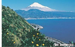
▲赤人が見た富士山を西むほど広がる海岸線

万葉歌人・山部赤人は「田子の浦ゆ 打ち出でて見れば 真白にそ 富士の高嶺に 雪は降りける」の歌を残している。詠まれた当時の田子の浦は、今と違い由比・浦原・興津あたりの海岸を指す。磯津峠付近で突然境界に飛び込んだ富士山の姿に対する感動が表れているとされる。