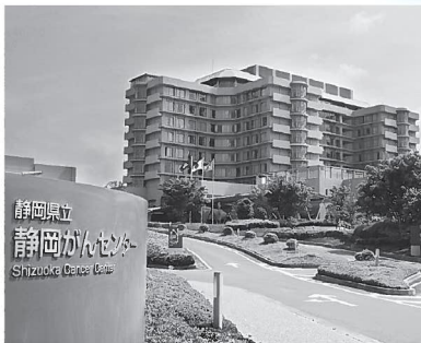
所在地 駿東郡長泉町下長窪1007番地

中でも「患者さんと家族の徹底支援」は「患者さんの目線で患者と家族に寄り添い、支えることが必要ではないか」との思いから生まれたもの。センターの最も重要な方針の一つであり、今もこれに基づいたさまざまな取り組みを展開しています。