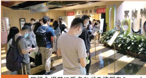
工夫① 施設入場前に氏名などの情報をショートメッセージで送信

今月は、県台湾駐在員事務所の宮崎所長からの「コロナ禍でも工夫して過ごす台湾の日常生活」です。台湾では、今年5月上旬以降、新型コロナウイルスの感染者が急増し、経済社会活動が制限されています。中でも工夫しながら、日常を過ごしている台湾の様子とは？ また、コロナ禍でも普段と変わらない果物販売店の風景も紹介しています。