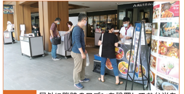
工夫② 屋外に臨時のワゴンを設置してお弁当を販売する飲食店