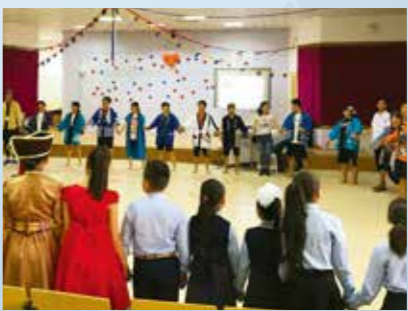
現地の高校生と手をつなぎ、一緒に「we are the world」を熱唱するモンゴル高校生交流団。