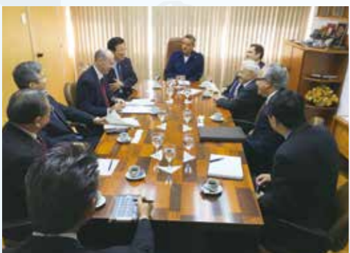
ITAでは、大学間交流や教育の重要性まで、次代を担う人材の育成について話が交わされた。

交流会に参加し、同会会長や日系人有力者と意見交換を行った。本県の知事が同地を公式に訪れたのは39年ぶり。今後の両県国による経済、観光などの分野における交流拡大に向け、期待が高まる訪問となった。