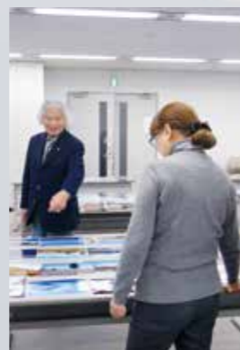
白旗氏には第1回から9年間、 コンテストの審査委員長を 務めていただいた。