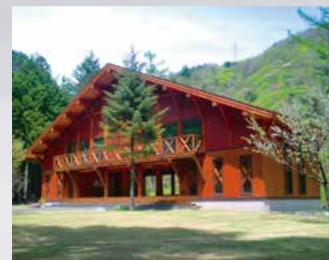
南アルプス南部の 登山拠点になっている樺島ロッジには、 「南アルプス白旗史朗写真館」がある。