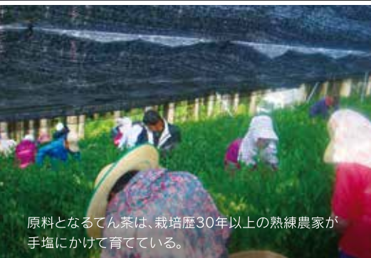
原料となるてん茶は、栽培歴30年以上の熟練農家が手塩にかけて育てている。