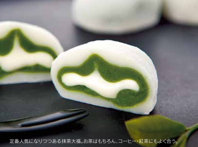
定番人気になりつつある抹茶大福。お茶はもちろん、コーヒー・紅茶にもよく合う。