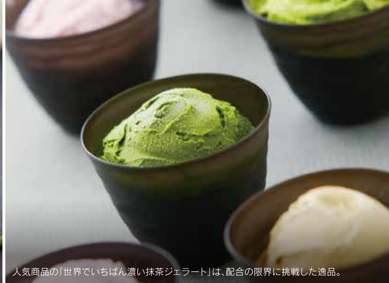
人気商品の「世界でいちばん濃い抹茶ジェラート」は、配合の限界に挑戦した逸品。