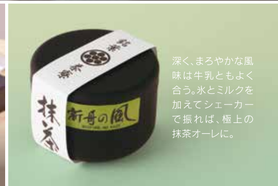
深く、まろやかな風味は牛乳ともよく合う。氷とミルクを加えてシェーカーで振れば、極上の抹茶オーレに。

深く、清らかで、甘く、苦い。相反する味の要素が複雑に絡み合いながら、口中で滋味と旨味が絶妙に溶け合う「藤枝産静岡抹茶」は、県内の熟練農家が土づくりからこだわり生産したてん茶のみから作られた抹茶だ。丁寧に石臼で挽いた抹茶は、茶道はもちろん、大福、ジェ