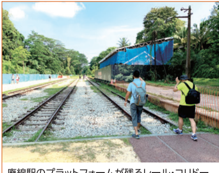
廃線駅のプラットフォームが残るレール・コリドー

廃線になったマレー鉄道の線路跡や、森の中に設けられている地上36mの空中遊歩道、シンガポールの街並みを360度見渡せる丘などさまざまな風景をお楽しみください!