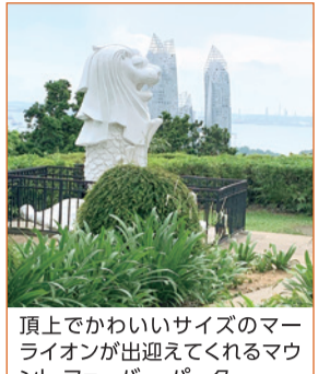
頂上でかわいいサイズのマウライオンが出迎えてくれるマウント・フェーバー・パーク