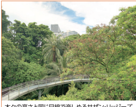
木々の高さと同じ目線で楽しめるサザン・リッジーズ