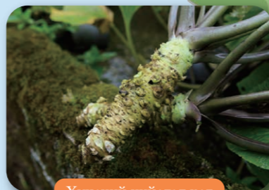
Хүнсний нийслэл хот

Зах зээлд нийлүүлэлтийн хэмжээ 2021 оны байдлаар 100% Япон улсын Хөгжим үйлдвэрлэлийн эхлэлийг тавьсан.