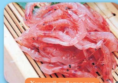
Хүнсний нийслэл хот

Үйлдвэрлэлийн хэмжээ 2022 оны байдлаар 37% Цай үйлдвэрлэхэд тохирсон цаг агаар, өндөр түвшинтэй үйлдвэрлэх арга туршлагагайгаараа Япон улсад тэргүүлдэг.