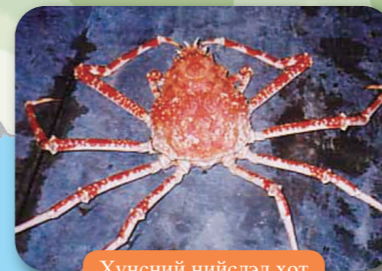
Хүнсний нийслэл хот

Нумарсан хэлбэртэй бүрхүүлтэй үерийн хамгаалалтын хаалга. Хөндлөн хэмжээ 40 метр, өндөр 9.3 метр