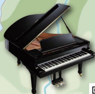
Үйлдвэрлэл, гар урлал

Хэмжээ 2022 оны байдлаар 26% Чихэрлэг ба исгэлэн амтны тэнцвэр сайтай гүн амттай