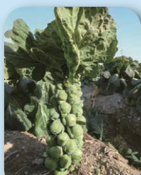
Хүнсний нийслэл хот

Тариалсан талбай 2022 оны байдлаар 31% Олон төрлийн цэцгийн сортоор алдартай