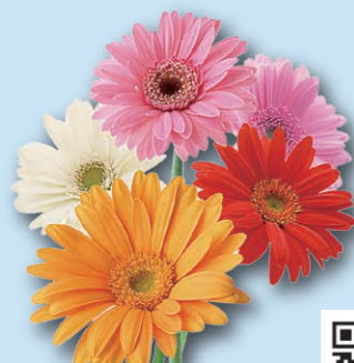
Цэцэгсийн нийслэл хот

Нийт хүн амын тоо: 3,553,518 хүн (2023 он 10 сар 1 өдөр) Нийт талбай: 7,777km 2 (2023)