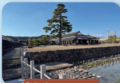
Соёл, Аялал жуулчилал

Ишний дагуу ургадаг онцлогтой байцаа бөгөөд 1 ширхэгээс 60-70 навч хурааж авах боломжтой.