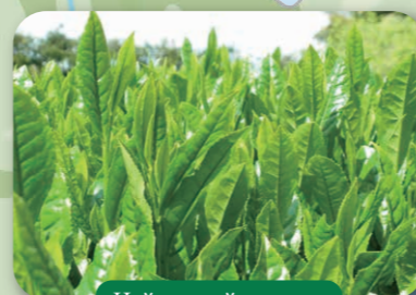
Цайны нийслэл хот

Бурханы ордон гэхээр үзэсгэлэнтэй сайхан байгалиас гадна, Япон улсын урлаг соёл, шашин шүтлэгийн эхлэл гэгддэг. 2013 онд 25 н төрлөөс бүрдэх Дэлхийн соёлын хосолмол өвд бүртгэгдсэн.