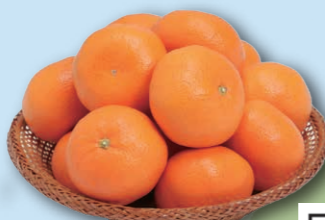
Хүнсний нийслэл хот

Нийлүүлэлтийн хэмжээ 2021 оны байдлаар 78% Жижиг оврын тоглоомын машин үйлдвэрлэлтээрээ алдартай.