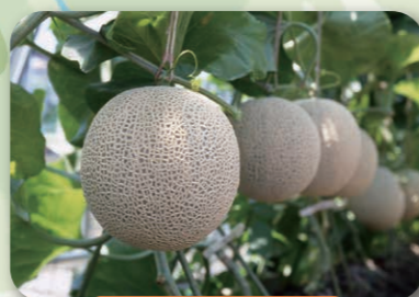
Хүнсний нийслэл хот

Нийт урт нь 897.4 м 1997 онд "Дэлхийн хамгийн урт модон гүүр" Гиннесийн номд бүртгэгдсэн Шимада хотын Ойгава гол дээр байдаг