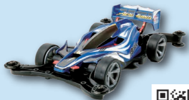
Үйлдвэрлэл, гар урлал