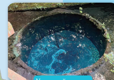
Усны нийслэл хот

Японы хамгийн өндөр Фүжи уул, хамгийн гүн Суруга далайн буланг харах боломжтой Японы хамгийн урт явган хүний дүүжин гүүр