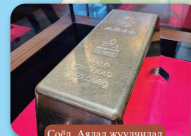
Соёл, Аялал жуулчилал

Номхон далайн Сүруга тохойд барих боломжтой дэлхийн хамгийн том хавч. Хавчуураа сунгах юм бол 3 метр хүрэх хэмжээтэй.