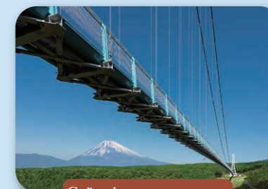
Соёл, Аялал жуулчилал

Нийт жин: 250 килограмм 2006 оны 2-р сард Гиннесийн номонд дэлхийн хамгийн том цул алтаар бүртгэгдсэн.