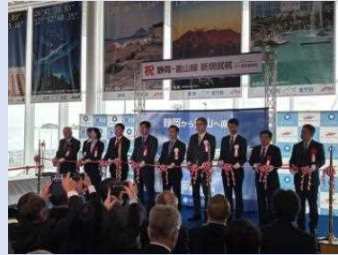
静岡-釜山線（エアプサン） 新規就航記念式典