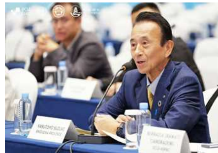
知事スピーチの様子