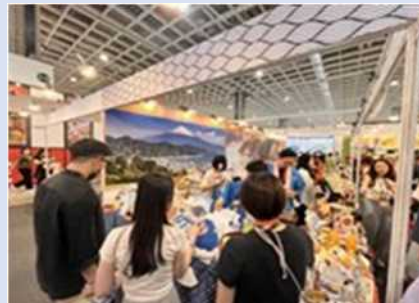
フード台北での本県ブース (台湾)