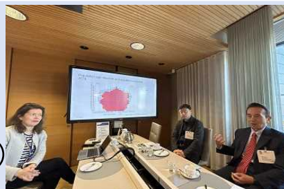
フィンランド社会保健省との意見交換