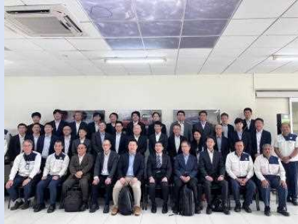
ビジネスミッション派遣 (インド)