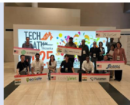
海外スタートアップの TECH BEAT Shizuoka参加