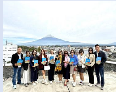
ファミトリップ (ベトナム)