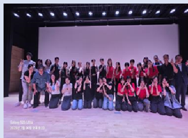
県内高校生の韓国派遣