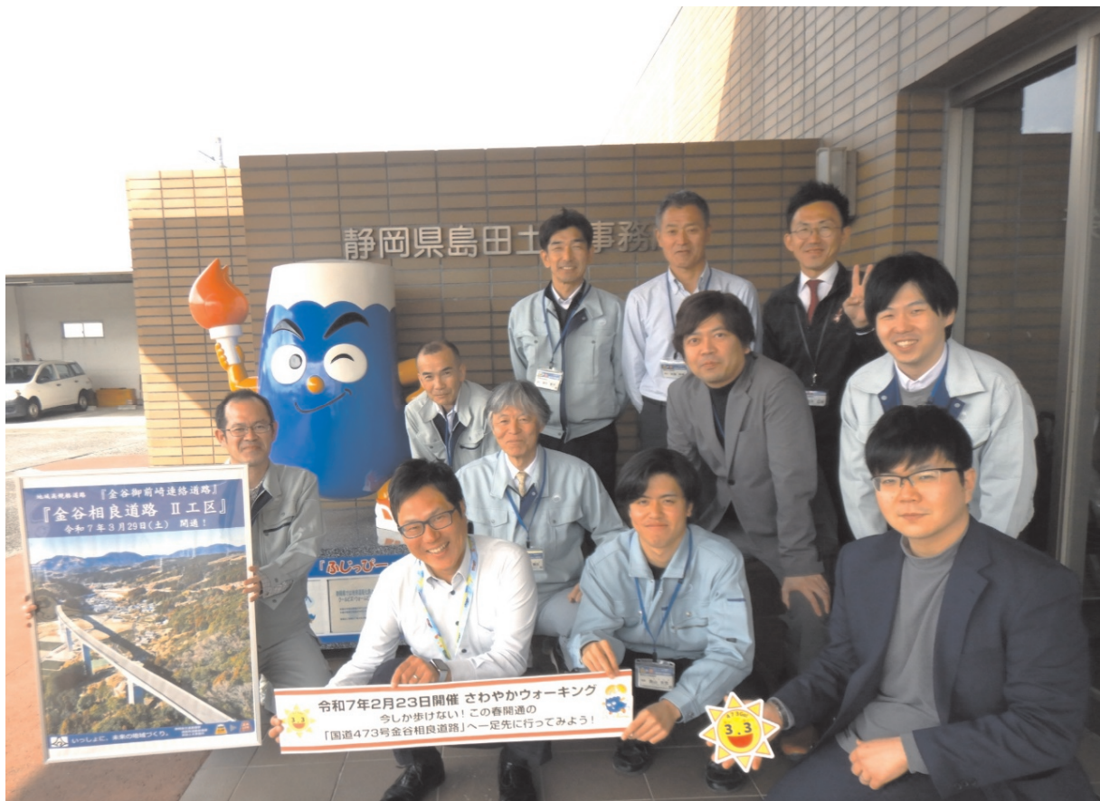
島田土木事務所 企画検査課・工事第1課