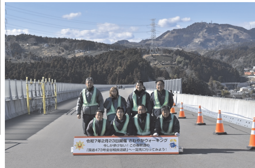
協力いただいた株式会社グロージオのみなさん