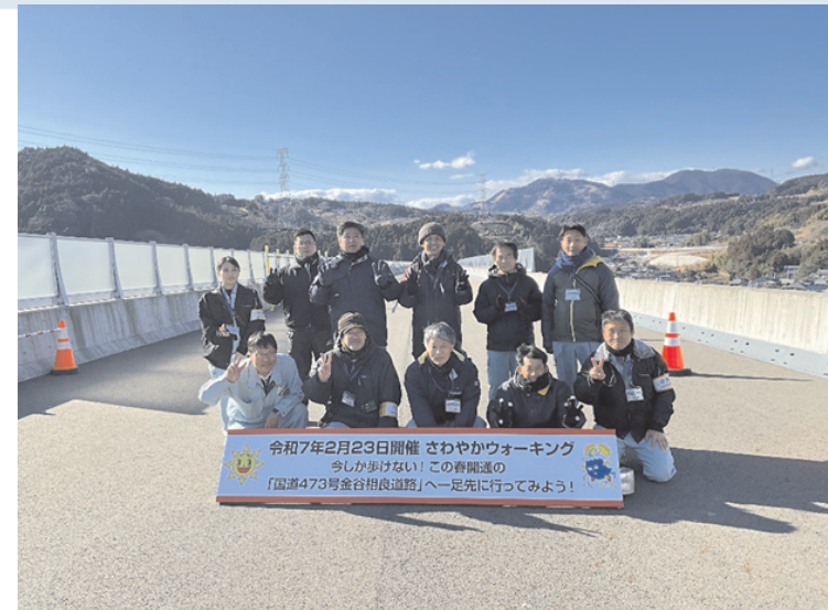
島田土木事務所 当日スタッフ