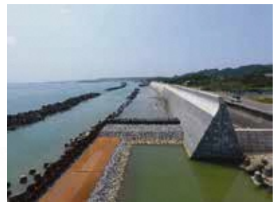
相良海岸（牧之原市）

「静岡県第4次地震被害想定」で示されたレベル1津波による背後地の浸水及び人的被害を防ぐため、堤防の高上げを進めています。牧之原市の相良海岸では、県・市・地元住民による意見交換を行い、平成27年度から、堤防の高上げ工事を実施しています。