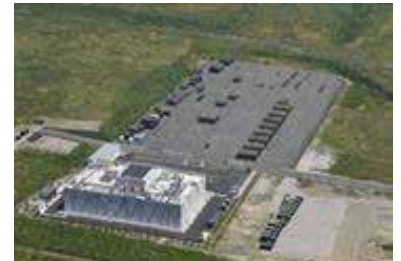
広域防災拠点（多目的用地2ha部分）

平成27年3月に国の災害応急対策活動を展開する「大規模な広域防災拠点」として位置付けられた富士山静岡空港を救急・救助、消火活動、医療活動、物資の受入、集積、分配などを行う総合的かつ広域的な防災拠点として、整備しました。また、実際に警察・消防・自衛隊などによる訓練を実施し、防災拠点としての運用の検証を行っています。