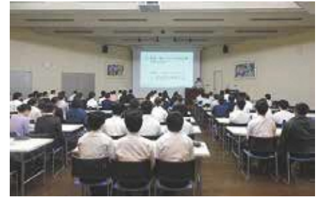
「税を知る出前講座」