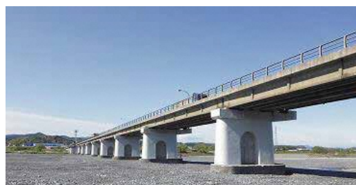
(主)島田吉田線 谷口橋