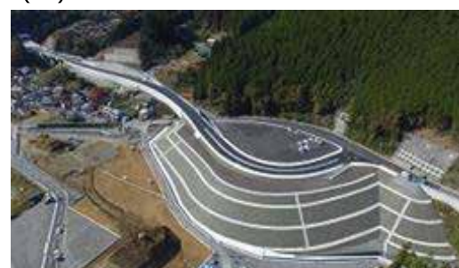
三遠南信自動車道(水窪佐久間道路)