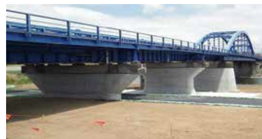
(一)古奈伊豆長岡停車場線 千歳橋