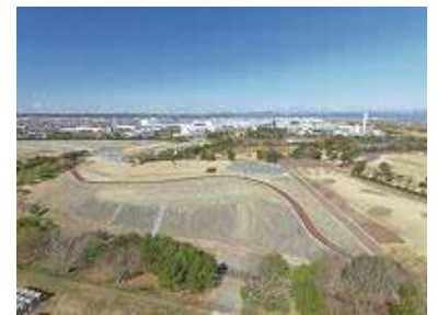
吉田公園命山（吉田町）

低平地の広がる沿岸市町では、東日本大震災の教訓を踏まえ、各地で津波避難ビルの指定や津波避難タワー建設、命山の整備などが進められています。県営「吉田公園」では、大規模地震による津波から来園者の生命を守るため、命山を2箇所整備しました。