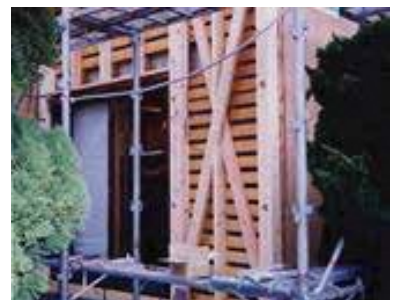
木造住宅耐震改修

住宅や建築物の倒壊から、県民の生命や財産を守るため、プロジェクト「TOUKAI-0」を推進し、木造住宅や危険なブロック塀の耐震改修等に対して補助する市町に助成しています。