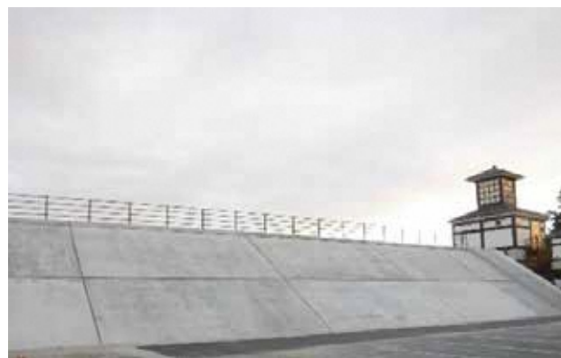
沼津牛臥海岸（海岸堤防）