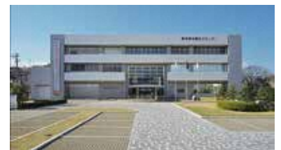
静岡県地震防災センター

令和2年6月にリニューアル・オープンしました。地震・津波の展示を充実するとともに、風水害、火山災害の展示を新設し、「知る 備える 行動する」をテーマに防災について学びながら体験することができます。また、「ふじのくに防災学講座」をはじめとした地域防災力の向上につながる各種講座や出張展示などを開催し、防災情報を発信しています。