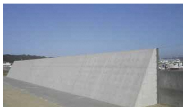
御前崎港海岸（胸壁）