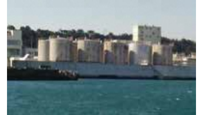
御前崎港海岸防潮堤（胸壁）

レベル1津波に対応した防潮堤等の津波防御施設を整備しています。御前崎港海岸では、臨海部で働く人をはじめ、県民の生命や資産を守るため、防潮堤（胸壁）の整備を実施しています。