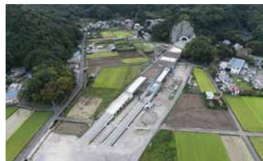
(国)414号 静浦バイパス