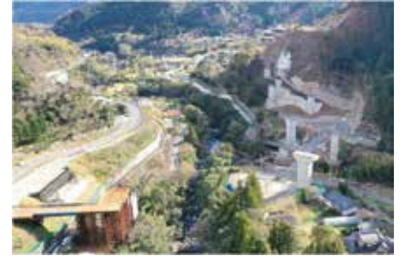
伊豆縦貫自動車道 (河津下田道路)

また、静浦バイパスは、南海トラフ巨大地震による津波発生時に迂回路としての役割を担うとともに、慢性的な渋滞の緩和に寄与する路線です。現在は、沼津アルプストンネル東側の高架部の整備を進めています。