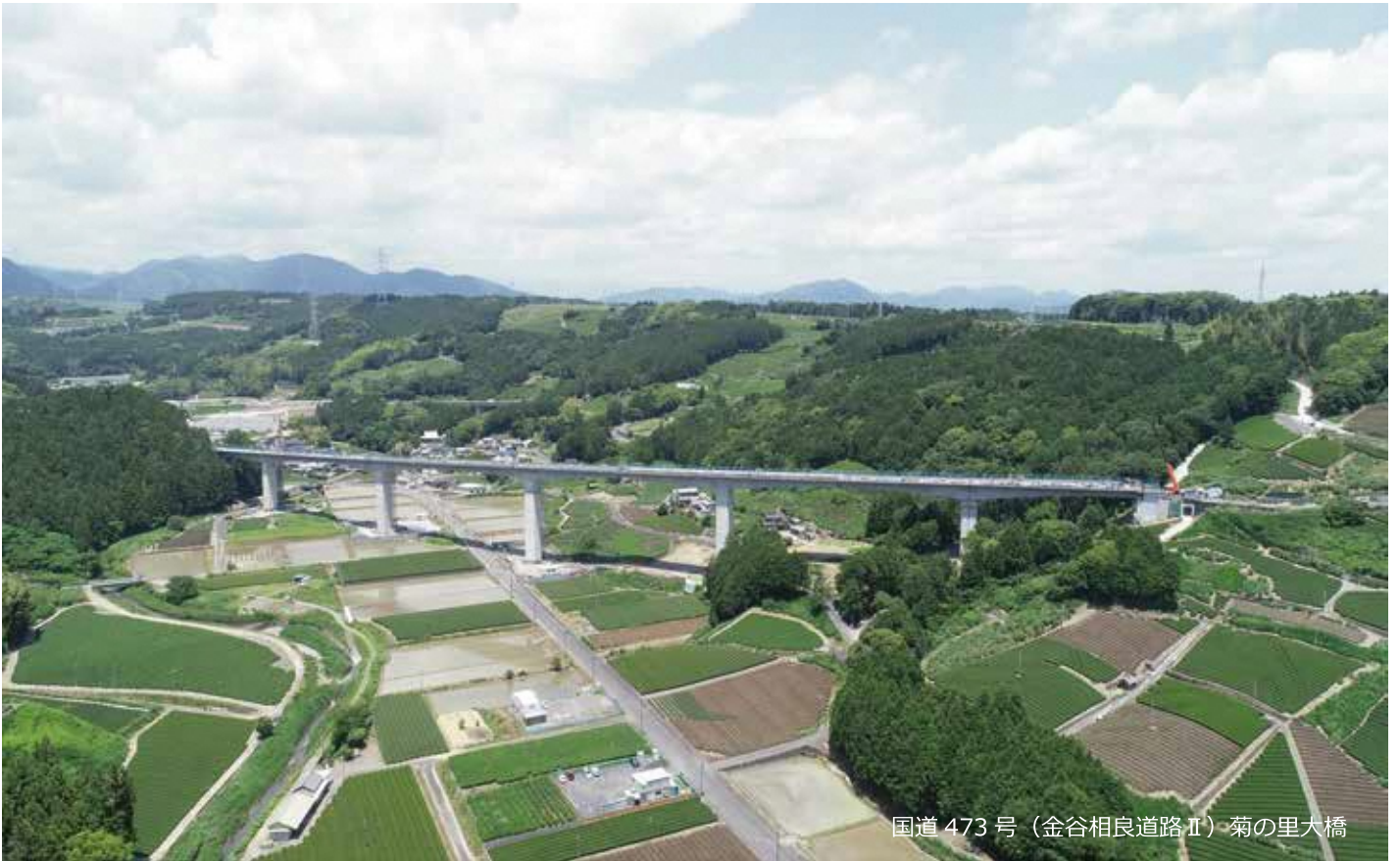
国道473号(金谷相良道路Ⅱ)・菊の里大橋